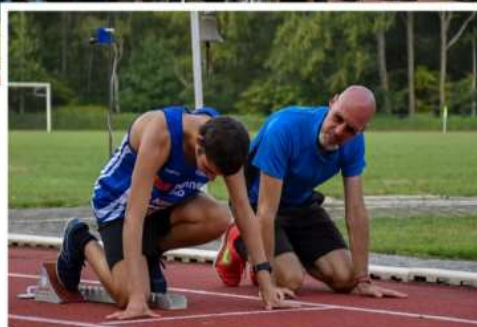
Het G-team traint iedere vrijdagavond om 19u in Herentals.

“Tegelijk kunnen ouders ontspannen en trainers genieten wanneer de atleten gelukkig zijn. Tijdens een meeting is er trouwens altijd een trainer in de buurt bij ieder nummer, want er komen op zo'n evenement veel prikkels af op de atleten. Daarom staat iedereen paraat om te helpen, ook trainers van andere clubs trou-