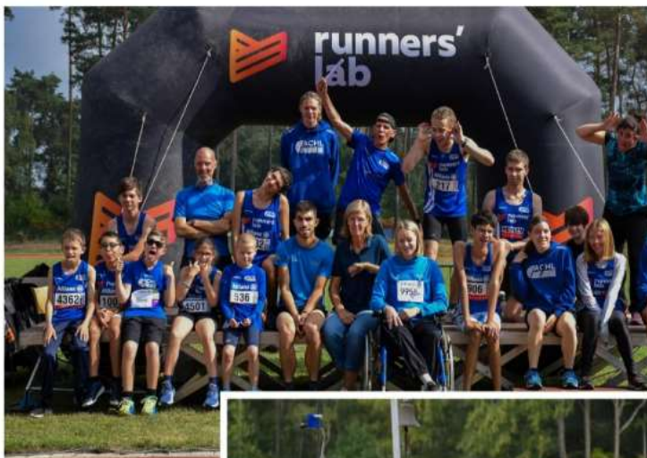
Het G-team van ACHL is klaar voor de Cronos ACHlympics.